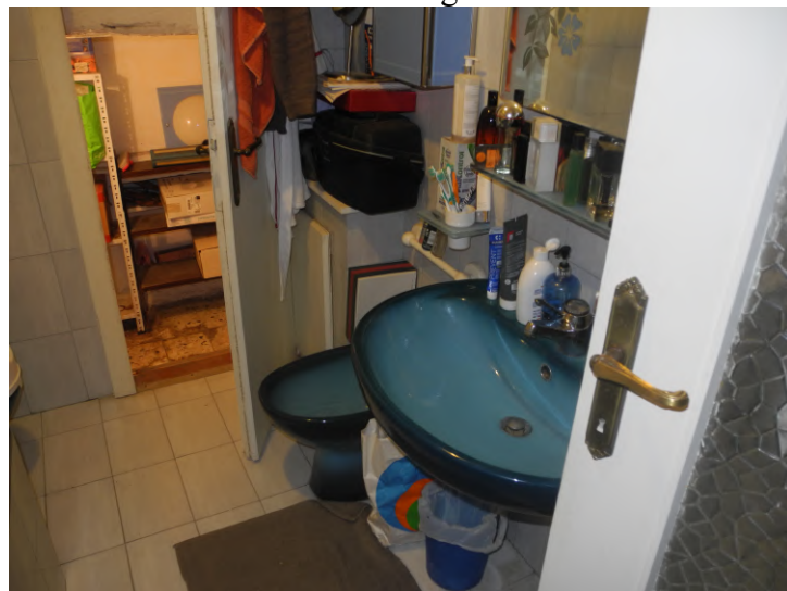
FOTO 24 – finestra bagno-w.c. orientata all'interno del vano scala di accesso al sottotetto