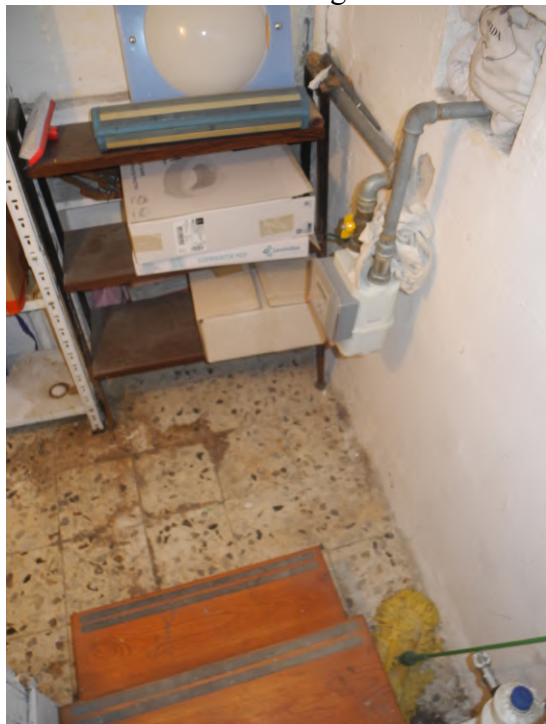
FOTO 25 – ripostiglio accessibile dal bagno-w.c. – installato contatore gas metano