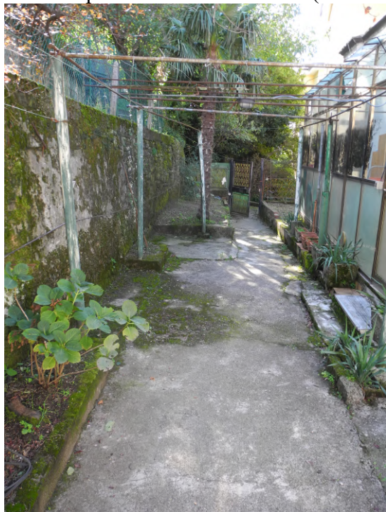
FOTO 7 – area p.c.n. 915/5; sulla destra, la veranda di accesso alla prima unità immobiliare (sub. cat. 5)